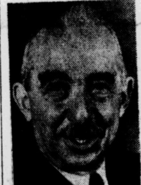
Presiden Republik Turkija ISMET INONUE

Program militer itu dipisah menjjadi empat bagian — tentera, angkatan udara, angkatan laut dan pekerdjaan umum. Untuk melaksanakan program itu ditahun jang lalu lebih dari 20 buah kapal pengangkut telah tiba membawa berat 2 tank, beribu 2 meriam, sedjumlah besar alat 2 perhubungan, mesin 2 pembikin djalan, obat 2 bedil, dan beribu 2 alat pengangkut. Dua buah kapal induk penuh sesak mengangkut pesawat 2 pelatih dan berat 2 pesawat 2 jager telah terbang sendirinja ke Turkija. Empat buah dari kapal selam USA, model mutakhir telah tiba di Istanbul dan banjak lagi kapal 2 jang ditunggu kedatangannya. Dienderal-major H. L. MacBride, kepala dari grup misi tentera, dida-